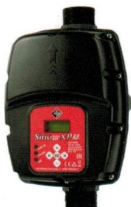
SIRIO ENTRY XP