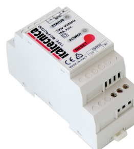
MODULO DI PROTEZIONE