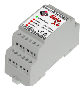
MODULO SIRIO X4